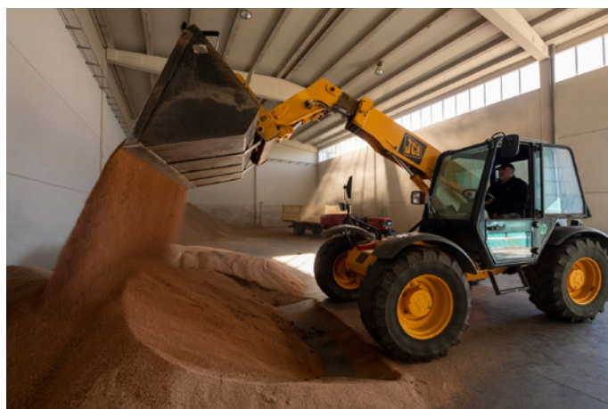
Residuos agrícolas de biomasa Agricultural biomass waste