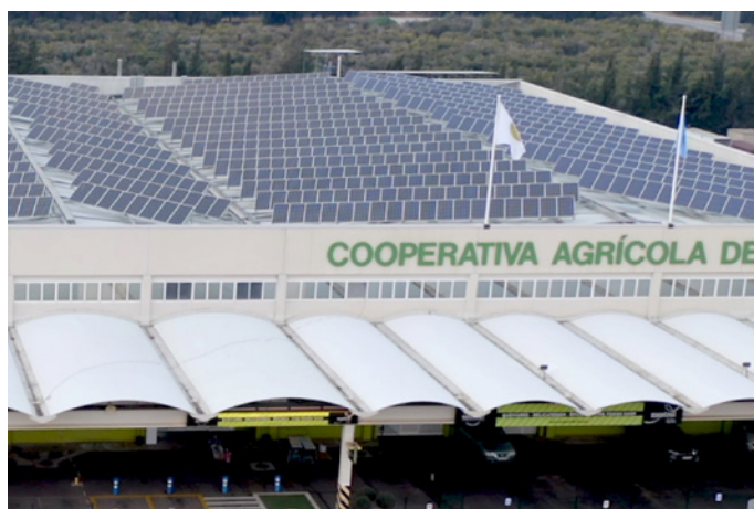
Planta fotovoltaica / Photovoltaic plant