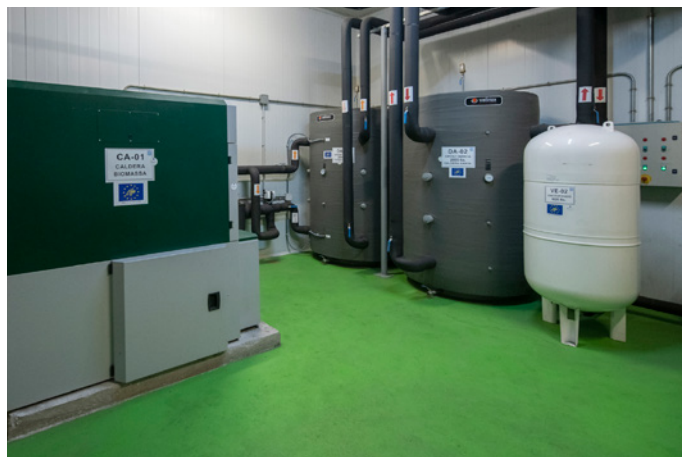
Nueva Caldera de biomasa instalada en Coop Cambrils. New biomass boiler installed in Coop Cambrils

The Agricultural Cooperative has led —together with three engineering companies, a research center and a communication company— the LIFE COOP2020 project (2014-2018). This environmental European project aimed to demonstrate the economic and environmental viability of a new business model for agricultural cooperatives, integrating energy saving, generating renewable energies and biomass production. Rural areas are dealing with a range of environmental problems: organic waste, resources and energy efficiency, and the increase of abandoned lands. We came to the conclusion that it is possible to value agricultural waste and energy crops as biomass (i.e. olive pits), renewable energy has been produced and a series of measures were implemented resulting in significant energy savings. The most important figures are the reduction of the electricity consumption by 20.32%, the reduction of the emissions of 163.7 tons of CO2 and the removal of all the solid fuels used in the industry.